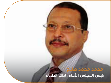
محمد محمد صالح رئيس المجلس الأعلى لبنك الطعام

إن تخصص البنك في مكافحة الجوع من خلال تخليق عوامل ومتطلبات تحقيق الأمن الغذائي وفق رؤية علمية وخبرة ميدانية تهدف لتوجيه الأعمال الإنسانية نحو تنمية مستدامة تأخذ بيد الأسر المستهدفة من ضيق الاعتماد على الآخرين إلى أفق الإكتفاء الذاتي تجعله في صدارة بنوك الطعام في العالم بجودة أدائه واستراتيجية تدخلاته وجديته في مكافحة جذور مشكلة الجوع وهذا ما يجعله محل فخر واعتزاز وثقة لكل رجال الأعمال الداعمين والمؤسسين .